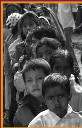
Ils comptent sur nous !